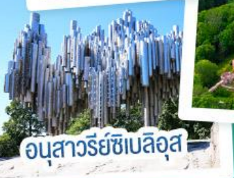
อนุสาวรีย์เซเบิลูส