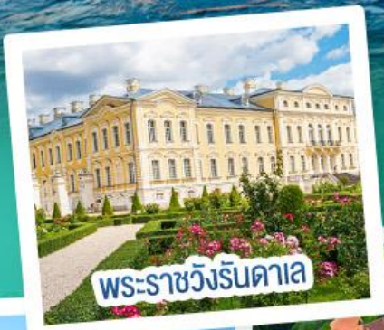
พระราชวังรินดาเล