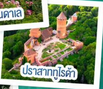
ปราสาทกูไรดา