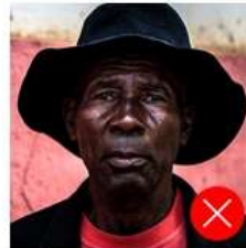
Back side is colored