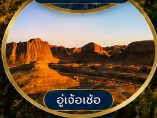
อู๋เจ้อเซ้อ