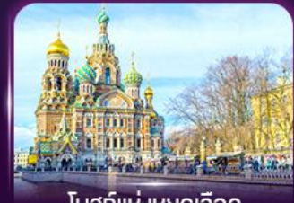
โบสถ์แห่งหยดเลือด