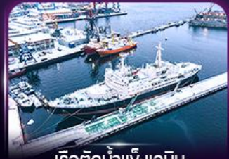
เรือตัดน้ำแข็งเลนิน