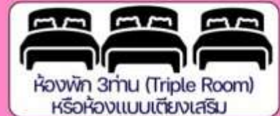
ห้องพัก 3 ท่าน (Triple Room) หรือห้องแบบเตียงเสริม

กรณีพัก 3 ท่านถ้าวันที่เข้าพักโรงแรม ไม่มีห้อง TRP (3 ท่าน) อาจจำเป็นต้องแยกพัก 2 ห้อง (มีค่าใช้จ่ายพักเดี่ยวเพิ่ม) กรณีห้อง TWIN BED (เตียงเดี่ยว 2 เตียง) ซึ่งโรงแรมไม่มีหรือเต็ม ทางบริษัทขอปรับเป็นห้อง DOUBLE BED แทนโดยมีต้องแจ้งให้ทราบล่วงหน้า หรือ หากต้องการห้องพักแบบ DOUBLE BED (1 เตียงใหญ่) ซึ่งโรงแรมไม่มีหรือเต็ม ทางบริษัทขอปรับเป็นห้อง TWIN BED แทนโดยมีต้องแจ้งให้ทราบล่วงหน้า กรณีห้องพักในเมืองที่ระบุไว้ในโปรแกรมมีเทศกาลวันหยุดยาว มีงานประชุมหรืองานแฟร์ต่างๆ บริษัทขอจัดที่พักในเมืองใกล้เคียงแทน