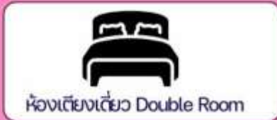
ห้องเตียงเดี่ยว Double Room