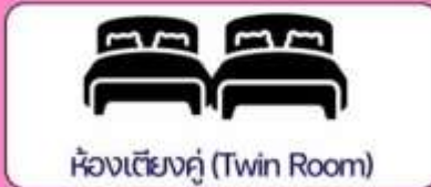
ห้องเตียงคู่ (Twin Room)