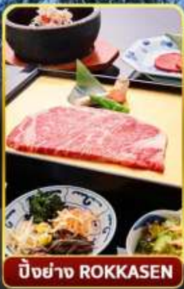
บิ๊งย่าง ROKKASEN