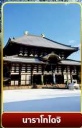
นาราโกโดจิ

พิเศษพักในเมืองคุสัทสึออนเซ็นพร้อมชมยูบาคาเกะ