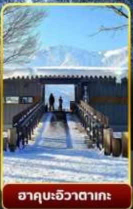
ฮาคุบะอิวาตาคะ