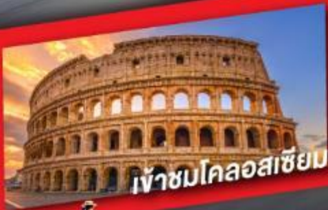
เข้าชมโคลอสเซียม