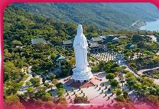
องค์กวนอิม วัดหลันอิ่ง