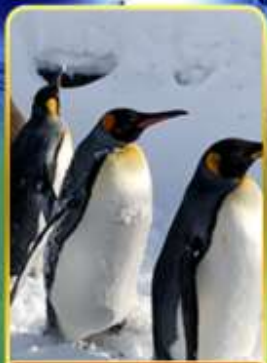
พาเหรดกเพนกวิน