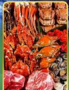
ปิ้งย่างพรีเมียมมันตะ