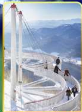
ระเบียงหมอกน้ำแข็ง