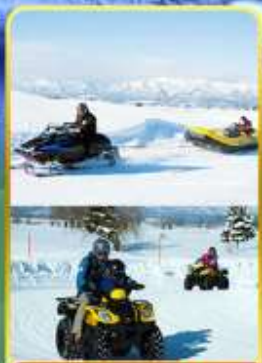
BIBAI SNOW LAND