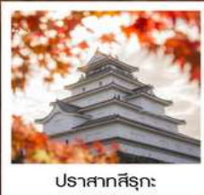
ปราสาทสิรุกะ