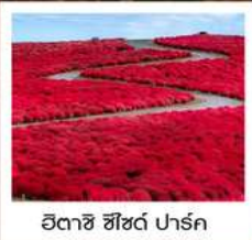
ฮิตาชิ ซีไซด์ พาร์ค