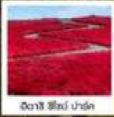
คิตาชิ ชิโอบะ ปาร์ค