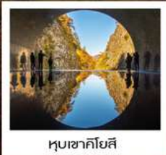
หุบเขาคิโยสึ

ฮิตาชิ ซีไซด์ พาร์ค / น้ำตกฟูจิโระ / สวนเก็บผลไม้ / หมู่บ้านโบราณโออุจิจูกุ ปราสาทสิรุกะ (ถ่ายภาพด้านนอก) / ทะเลสาบโทชิคินุมะ / ศาลเจ้ายาฮิโกะ สวนยาฮิโกะ / ตลาดปลาทะเลโอดามาริ / หุบเขาคิโยสึ / คาวาบะ: เดินเอ็น พลาซ่า นั่งกระเช้าลอยฟ้านาเอบะ: ดรากอนโดล่า / เมืองคาวาโกเอะ สวนฮิโนะคาชิระ / วัดจินโดจิ / ซุปป์ิงชินจูกุ