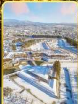
หอดาวห้าแฉก