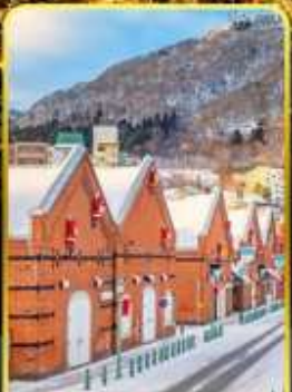
โกดังอิฐแดง