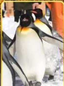
มิถุซามารีนพาร์ค