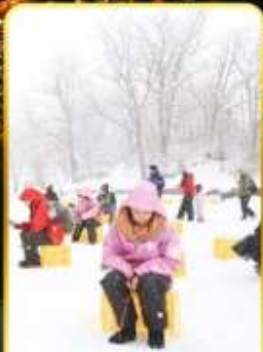
ตกปลาน้ำแข็ง