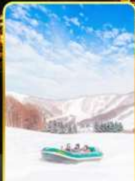
กิจกรรมสโนว์ราฟติง