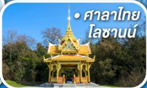
• ศาลาไทย โลซานน์

• สุดอากาศดีที่เซอร์แมท • ขึ้นกระเช้าสู่ยอดจากลาเซียร์ 3000 • ชมเมืองคลาสสิกเบิร์น ลูเซิร์น ซูริก