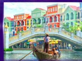
เวนิสจำลอง แกรนด์ เวิลด์