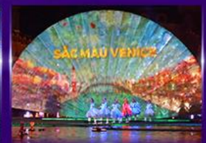
Sac Mau Venice Show