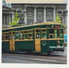
หาดหญ้าแดงผานจิ้น