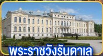
พระราชวังรินดาลา