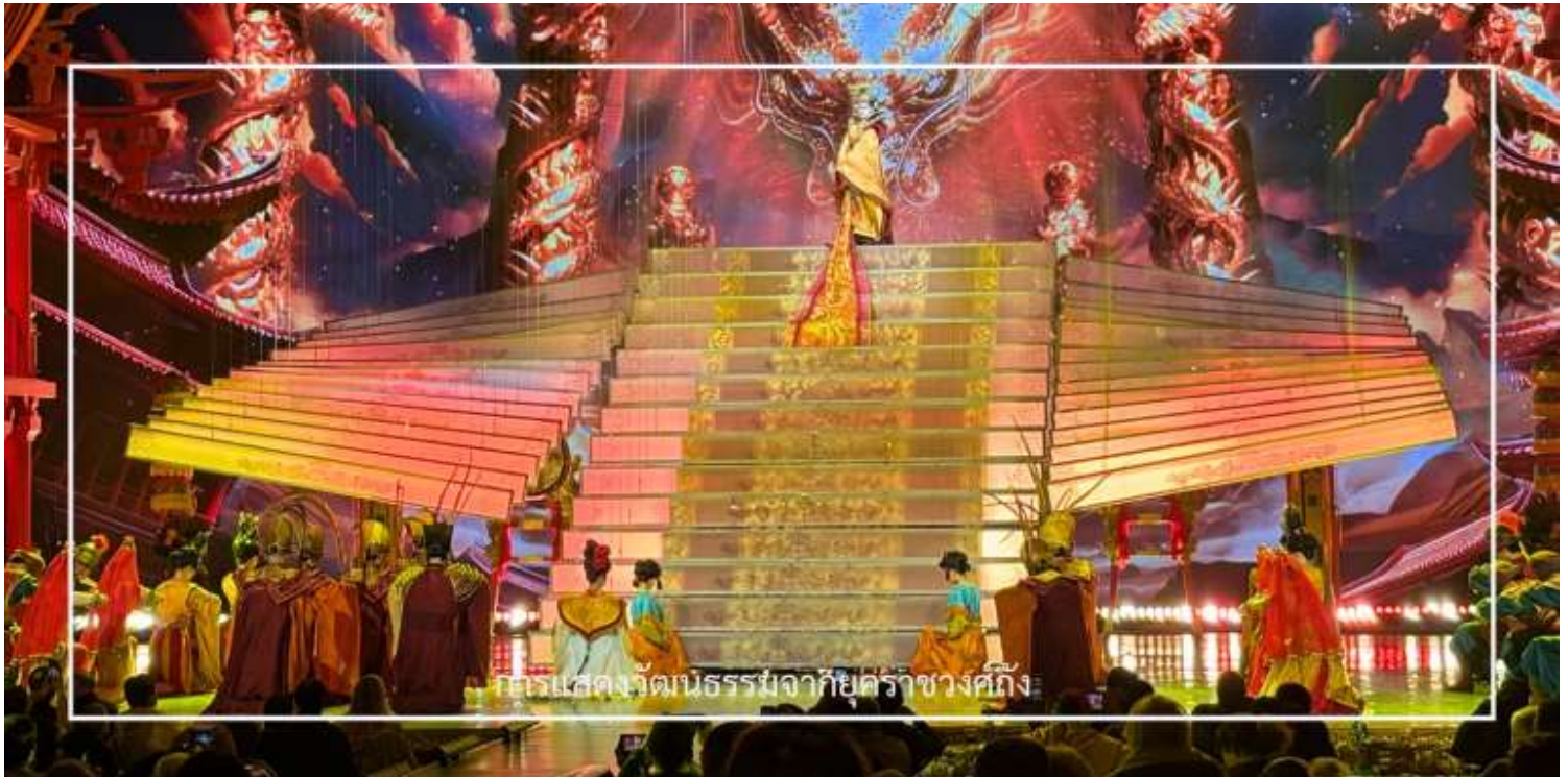
การแสดงวัฒนธรรมจากยุคราชวงศ์ถัง

ท่านจะได้ชมการแสดงวัฒนธรรมจากยุคราชวงศ์ถัง อันตระการตา ที่ผสมการฟ้อนรำ เพลง และเครื่องแต่งกายงดงามอย่างประณีต ถ่ายทอดความรุ่งเรืองและชีวิตอันหรูหราของยุคถึง โดยนักแสดงมืออาชีพที่มีทักษะโดดเด่น