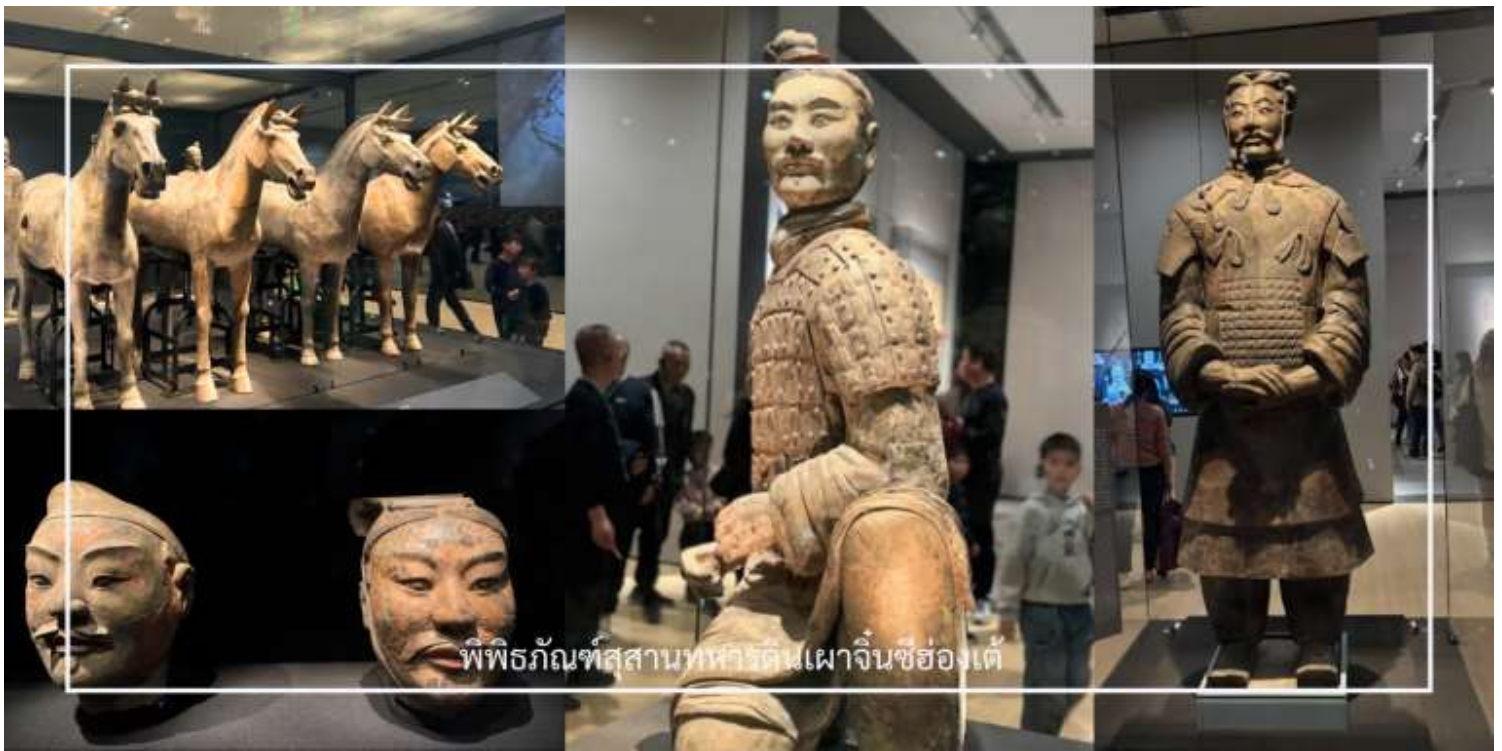
พิพิธภัณฑ์สถานทหารดินเผาจีนซีอองเต้

สมควรแก่เวลา นำท่านเดินทางสู่เมือง ซีอาน ใช้เวลาเดินทางประมาณ 50 นาที