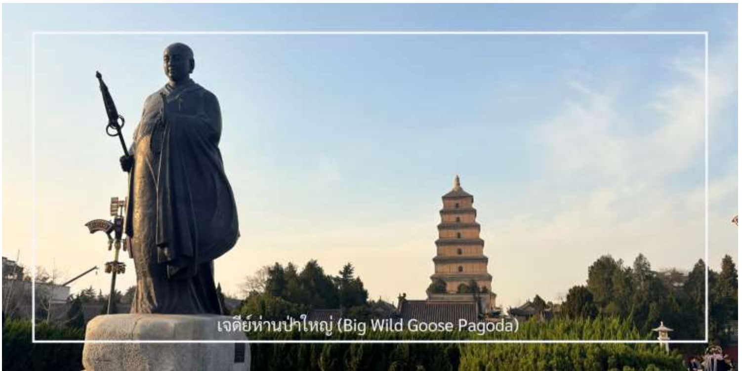
เจดีย์ห่านป่าใหญ่ (Big Wild Goose Pagoda)

เดินทางสู่ ถนนคนเดินต้าถิง (Great Tang All Day Mall) อีกหนึ่งแลนด์มาร์คสุดฮิตของเมืองซีอาน ตั้งอยู่ใกล้กับเจดีย์ห่านป่าใหญ่ อลังการด้วยการออกแบบที่จำลองบรรยากาศความรุ่งเรืองในยุคราชวงศ์ถัง สองฟากถนนเรียงรายด้วยอาคารสไตล์จีนประยุกต์ ผสมผสานกลิ่นอายโบราณเข้ากับความร่วมมือได้อย่างลงตัว เต็มอิมกับการเลือกชมและเลือกซื้อสินค้า ในร้านค้าของที่ระลึก คาเฟ่ ร้านอาหาร และเครื่องดีมีชื่อดัง พร้อมชม การแสดงศิลปะพื้นบ้านกลางแจ้ง ไม่ว่าจะเป็นดนตรีสด การแสดงหุ่นเงา การรำโบราณ รวมถึงการแสดงแสง สี เสียง ตามจุดต่าง ๆ ตลอดแนวถนน สำหรับผู้ที่ชื่นชอบของสะสมและฟิกเกอร์ชื่อดัง ไม่ควรพลาดการแวะชม Pop Mart ที่ตั้งอยู่ในห้างใหญ่ตรงข้ามถนนคนเดิน ภายในมีคอลเลกชันฟิกเกอร์หลากหลายแบบให้เลือกสะสม ท่ามกลางการตกแต่งที่ทันสมัยและเป็นเอกลักษณ์ ถนนสายนี้จึงเปรียบเสมือนการเดินทางข้ามกาลเวลา สัมผัสทั้งวัฒนธรรมดั้งเดิมและเทรนด์ร่วมสมัยได้ในที่เดียวกัน