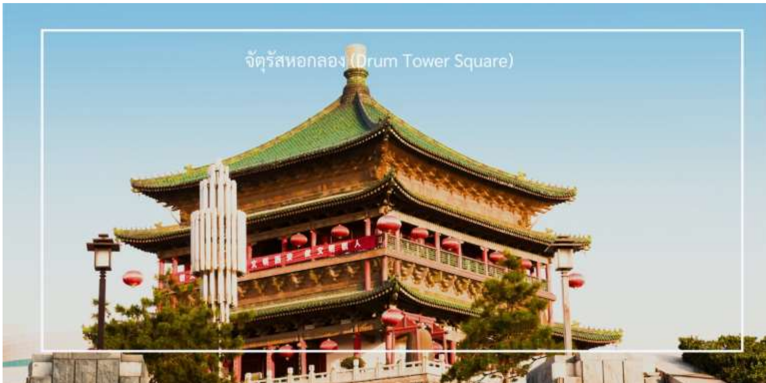
จัตุรัสทอกลอง (Drum Tower Square)

สมควรแก่เวลา นำท่านเดินทางสู่ สถานีรถไฟความเร็วสูงเมืองซีอาน เพื่อออกเดินทางสู่เมืองหยุนเฉิง (Yuncheng) โดยรถไฟความเร็วสูง ใช้ระยะเวลาเดินทางประมาณ 1.20 ชั่วโมง ระหว่างทางให้ท่านเพลิดเพลินกับทัศนียภาพสองข้างทาง ผ่านหน้าต่างของขบวนรถไฟที่ทันสมัย สะดวกสบาย และรวดเร็ว อีกหนึ่งประสบการณ์การเดินทางที่ทั้งผ่อนคลายและประทับใจ