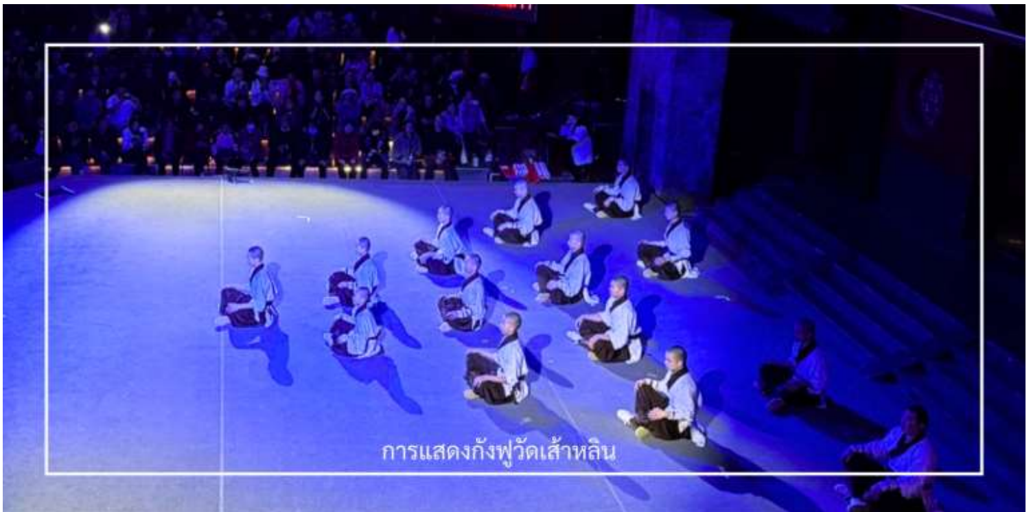
การแสดงกังฟูวัดเส้าหลิน

ไม่พลาด! กับประสบการณ์สุดพิเศษ ชมการแสดงกังฟูวัดเส้าหลิน ศิลปะการป้องกันตัวระดับตำนานที่เลื่องชื่อไปทั่วโลก การแสดงถ่ายทอดความแม่นยำ รวดเร็ว และแข็งแกร่งของวิทยายุทธเส้าหลิน ผ่านกระบวนการที่ได้รับแรงบันดาลใจจาก สัตว์นานาชนิด เช่น เสือ งู กระเรียน ผสานเข้ากับการตีลังกา หมุนตัว และการควบคุมร่างกายอันน่าทึ่ง ด้วยแสง สี เสียง และดนตรีประกอบฉากที่จัดเต็ม ทำให้โชว์นี้เต็มไปด้วยพลังและความเร้าใจ นอกจากนี้ ผู้ชมยังมีโอกาสได้มีส่วนร่วมบนเวที เพิ่มความสนุกสนาน และประทับใจไม่รู้ลืม