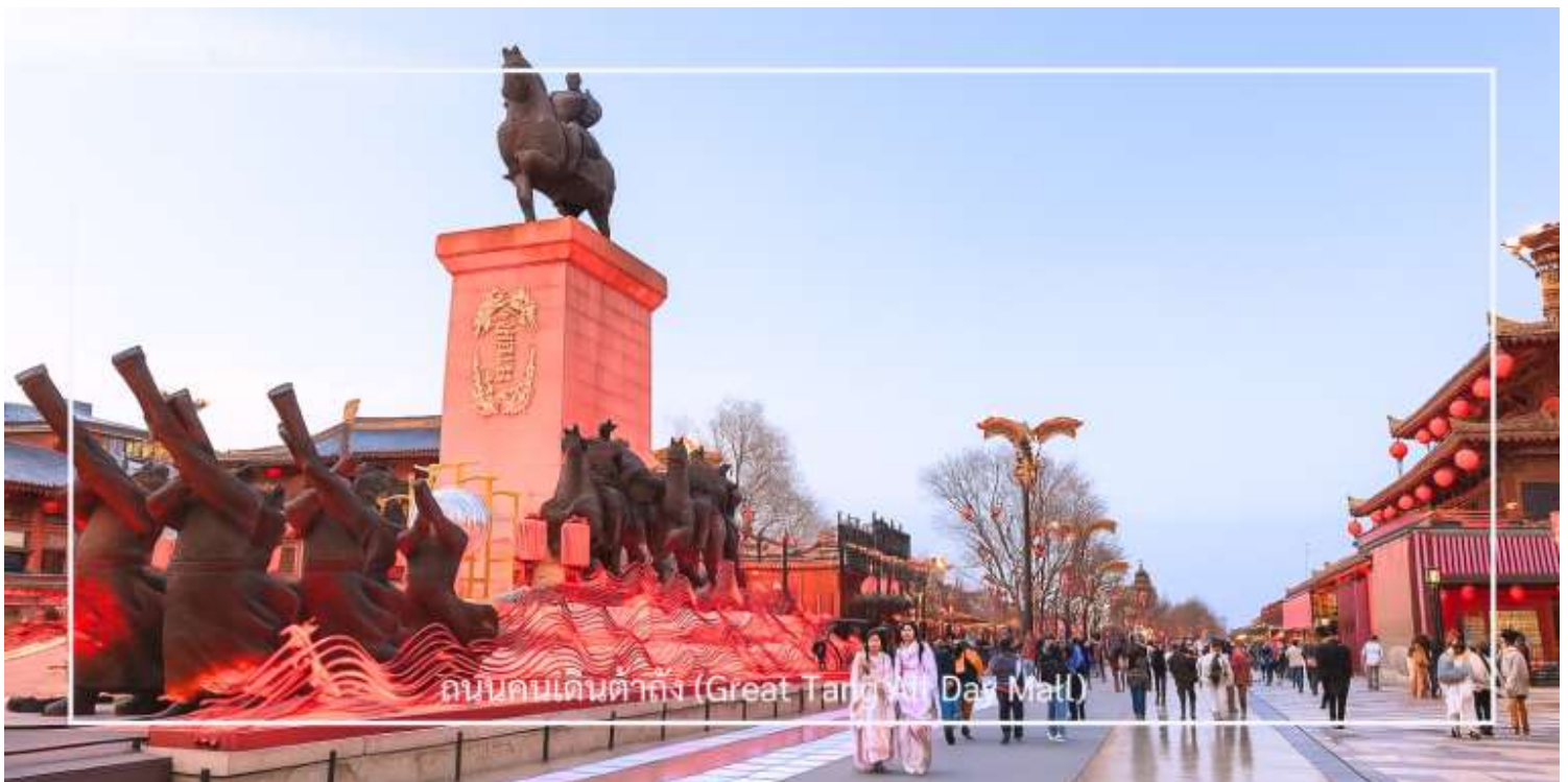
ถนนคนเดินต้าถิง (Great Tang All Day Mall)

เดินทางสู่ ถนนคนเดินต้าถิง (Great Tang All Day Mall) อีกหนึ่งแลนด์มาร์คสุดฮิตของเมืองซีอาน ตั้งอยู่ใกล้กับเจดีย์ห่านป่าใหญ่ อลังการด้วยการออกแบบที่จำลองบรรยากาศความรุ่งเรืองในยุคราชวงศ์ถัง สองฟากถนนเรียงรายด้วยอาคารสไตล์จีนประยุกต์ ผสมผสานกลิ่นอายโบราณเข้ากับความร่วมมือได้อย่างลงตัว เต็มอิมกับการเลือกชมและเลือกซื้อสินค้า ในร้านค้าของที่ระลึก คาเฟ่ ร้านอาหาร และเครื่องดีมีชื่อดัง พร้อมชม การแสดงศิลปะพื้นบ้านกลางแจ้ง ไม่ว่าจะเป็นดนตรีสด การแสดงหุ่นเงา การรำโบราณ รวมถึงการแสดงแสง สี เสียง ตามจุดต่าง ๆ ตลอดแนวถนน สำหรับผู้ที่ชื่นชอบของสะสมและฟิกเกอร์ชื่อดัง ไม่ควรพลาดการแวะชม Pop Mart ที่ตั้งอยู่ในห้างใหญ่ตรงข้ามถนนคนเดิน ภายในมีคอลเลกชันฟิกเกอร์หลากหลายแบบให้เลือกสะสม ท่ามกลางการตกแต่งที่ทันสมัยและเป็นเอกลักษณ์ ถนนสายนี้จึงเปรียบเสมือนการเดินทางข้ามกาลเวลา สัมผัสทั้งวัฒนธรรมดั้งเดิมและเทรนด์ร่วมสมัยได้ในที่เดียวกัน