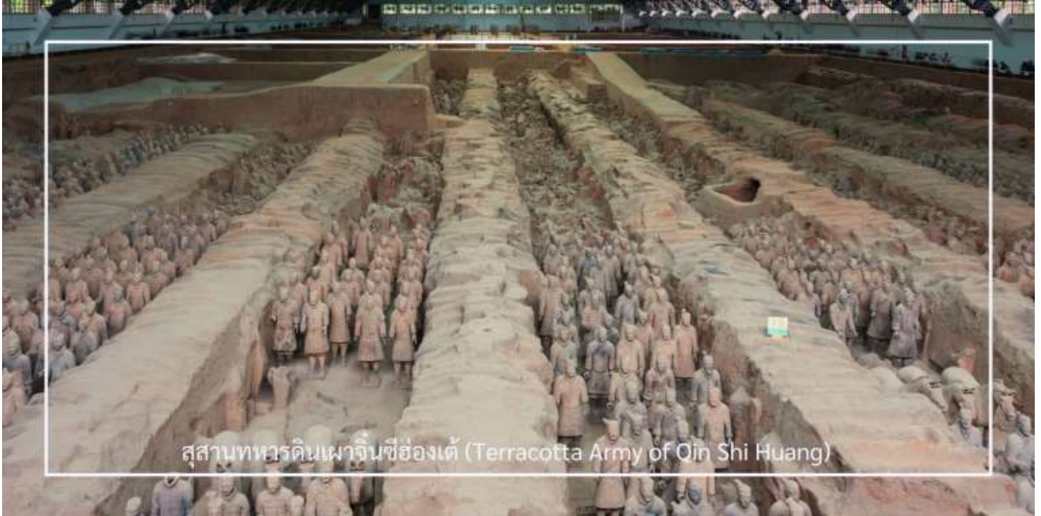
สุสานทหารดินเผาจีนซีฮ่องเต้ (Terracotta Army of Qin Shi Huang)

นำท่านเดินทางสู่ สุสานทหารดินเผาจีนซีฮ่องเต้ (Terracotta Army of Qin Shi Huang) หนึ่งในสิ่งมหัศจรรย์ของโลก ยุคโบราณและแหล่งโบราณคดีที่สำคัญที่สุดของจีน ตั้งอยู่ใกล้เมืองซีอาน มณฑลส่านซี ค้นพบโดยบังเอิญในปี ค.ศ. 1974 ก่อนจะได้รับการขึ้นทะเบียนเป็นมรดกโลกโดยยูเนสโกในปี ค.ศ. 1987 สุสานแห่งนี้คือสถานที่ฝังพระศพของ “ จีนซีฮ่องเต้ ” จักรพรรดิองค์แรกของจีนผู้รวบรวมแผ่นดินเป็นหนึ่งเดียวในยุคราชวงศ์ฉิน ครอบคลุมพื้นที่หลายหมื่นตาราง เมตร แบ่งเป็น 3 หลุม ซึ่งภายในมีทหารดินเผากว่า 8,000 ตัว ที่ถูกสร้างขึ้นอย่างประณีต มีใบหน้า ท่าทาง และเครื่องแต่งกายแตกต่างกันไป พร้อมด้วยรถศึก ม้า และอาวุธโบราณ ที่วางเรียงรายอย่างเป็นระเบียบในหลุมฝังศพ เพื่อปกป้อง จักรพรรดิในชีวิตหลังความตาย