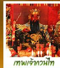
เทพเจ้ากวนไท