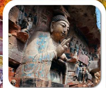
"พาสินแกะสลักต้าจู้"