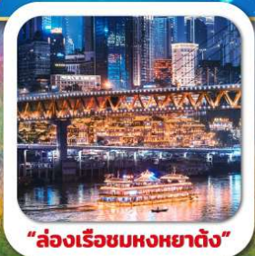
"ล่องเรือชมหงหยาดัง"