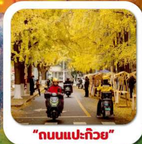
"ถนนแปะก๊วย"

นั่งกระเช้าชมภูเขาหวงอุ๊ซาน ขุนเขาใบไม้แดงอันดับหนึ่งของประเทศจีน เมืองชู่หยหนิง วัดหลิงจวน (วัดเจ้าแม่กวนอิมกะพริบตา) - พาสินแกะสลักต้าจู้ หงหยาดัง ถนนแปะก๊วย ตึกตะเกียบ วัดหลัวซัน ล่องเรือชมวิวฉิ่ง