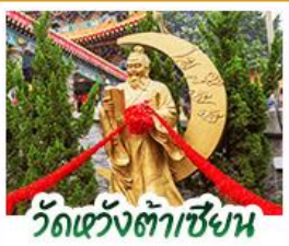
วัดเขangkต้าเซียน

วัดหวังต้าเซียน ขอพรสุขภาพ ความรัก • วัดปึกโตย่องฮา ขอพรเรื่องความสำเร็จ ในชีวิตและ-การงาน • วัดเขangkหมิว ขอพรองค์แซกง โชคลาภ การเงินและ-ธุรกิจ วัดกวนไท ขอพรเจ้ากวนอู ความซื่อสัตย์ ธุรกิจมั่นคงและ-เงินทอง