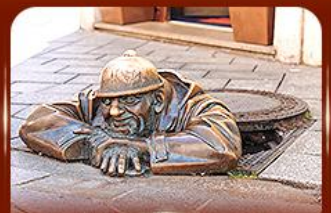
แลนด์มาร์คดัง รูปปั้นคูมิล ปรากติสลาวา