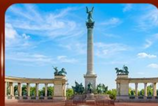
จัตุรัสวีรบุรุษ บูดาเปสต์