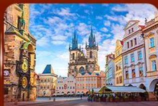
ชมย่านเมืองเก่า ปราก