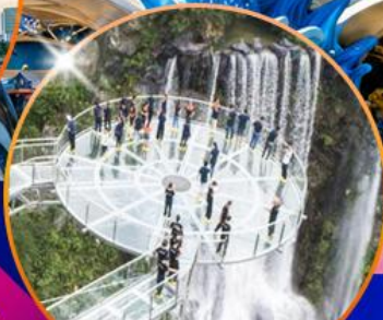
สะพานแก้วถูหลงเซี่ยะ