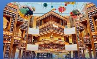
ห้องสมุดคSTARพีค