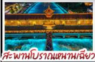
สะพานโบราณหนานชิว

อุทยานคำกู่ปิงชวณ - อุทยานสี่ดรุณี - หมี่แพนด้าเซลฟี่ ป่าไฟไม้น้ำตึกSKP - อุทยานปีแห่งโถง - สะพานโบราณหนานชิว สตรีทอาร์ต Eastern Suburb Memory - เมืองโบราณลั่วตี้ เบมูพิศฆ ม้าไฟพม่าล่า