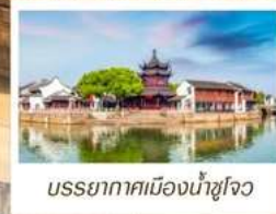
บรรยากาศเมืองน้ำซูโจว