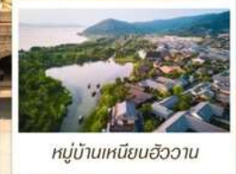
หมู่บ้านเหนียนฮิววาน