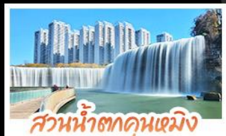
ส่วนน้ำตกคุณหมิง