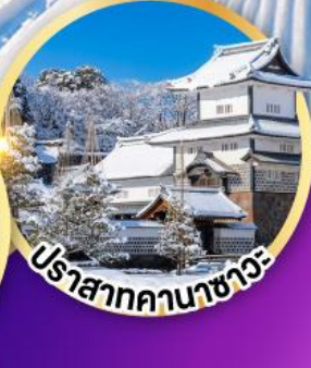
ปราสาทคานาซาวะ

ล่องเรือสำราญโซกาวะ ชมบรรยากาศหิมะและธรรมชาติ สวนเคนโระคุเอ็น 1 ใน 3 สวนที่งดงามที่สุดของญี่ปุ่น