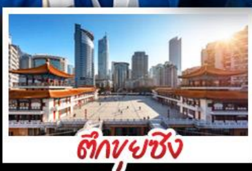
ตึกขุยซิง