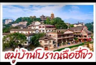
หมู่บ้านโบราณฉือซิง

พระเอกสลักหินตำจู้ - ตึกตะเกียบ Raffles City - ตึกขุยซิง เกรตเตอร์เบียร์ - หมู่บ้านโบราณฉือซิง