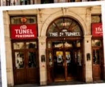
สถานีนูนา (TUNEL STATION) สถานีรถไฟใต้ดินสายเก่าแก่และเป็นหนึ่งในระบบขนส่งที่เก่าแก่ที่สุดในโลก