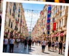
ISTIKLAL STREET (Grand Avenue of Pera) ถนนสายช้อปปิ้ง ยืน 88 ครบรอบในทีเดียว