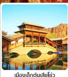
เมืองเล็กตันเสี่ยโซ่ว