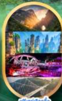
ฟรีคีย์เลือกซื้อ Option เสริม