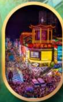
ถนนคนเดินชิงสวี่