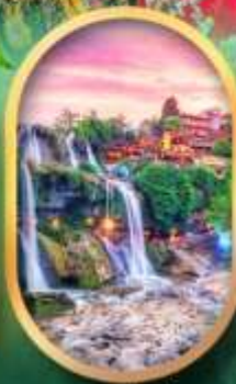
ฟูหลงเจินน้ำตก