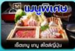
เชิธบาย ฮาญ สิบสองกุ่มัน