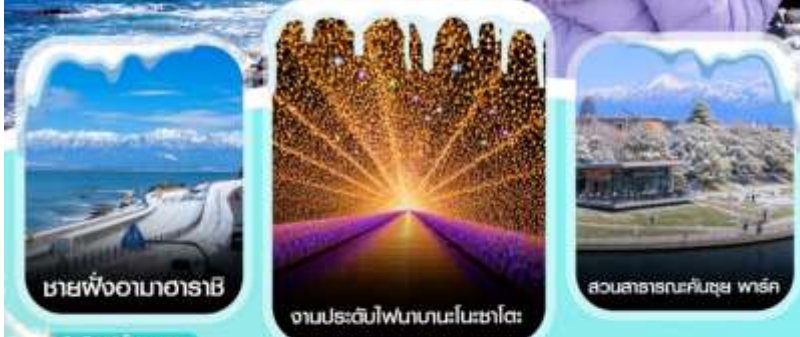
ชายฝั่งอามาฮาระชิ