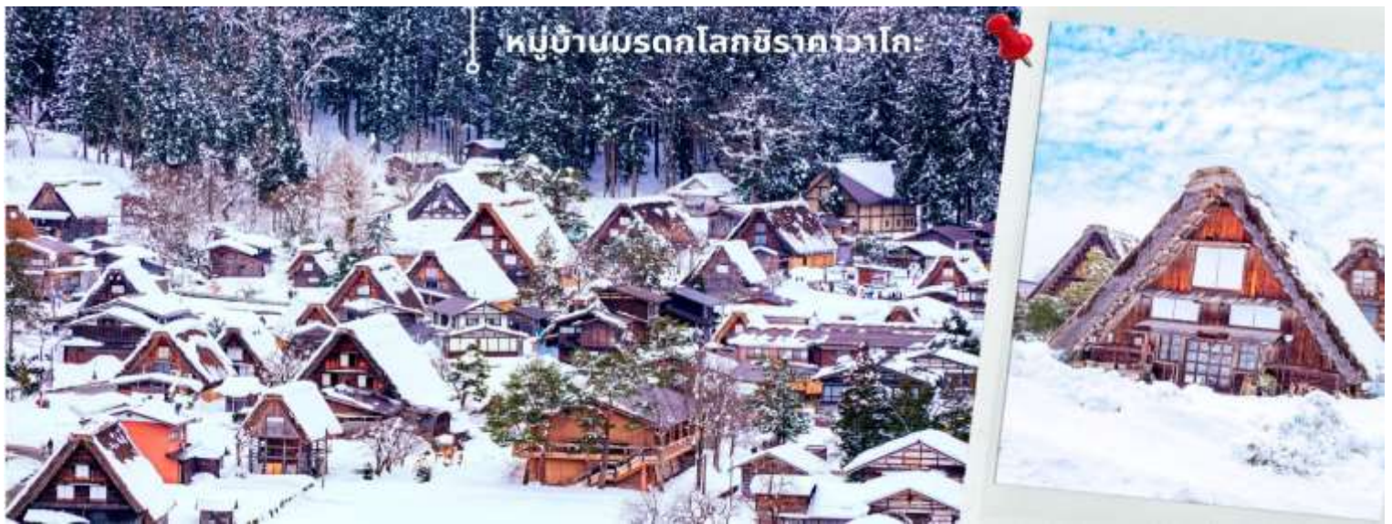
** การตกและความหนาของหิมะขึ้นอยู่กับสภาพอากาศ**