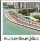
สะพานเหยียนหัวเจียว