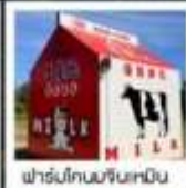
ฟาร์มโคนมจินเหมิน