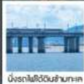
นั่งรถไฟใต้ดินข้ามทะเล