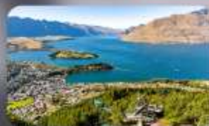
นั่ง Skyline สู่ Bob's Peak