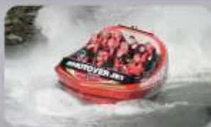
สนุกกับเรือ Shotover Jet