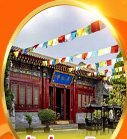
วัดกวางเหริน