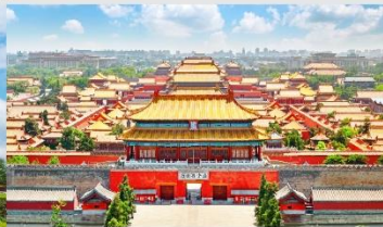
พระราชวังต้องห้ามกุ่กวง

*ทางบริษัทฯ ขอสงวนสิทธิ์ในการสลับโปรแกรมทัวร์ตามความเหมาะสมขึ้นอยู่กับสถานการณ์หน้างาน โดยคำนึงถึงผลประโยชน์ของลูกค้าเป็นสำคัญ