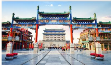
ถนนโบราณเฉียนเหมิน