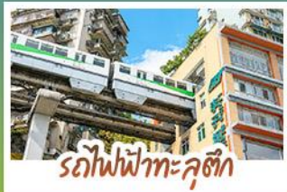
รถไฟฟ้าทะเลคุตึก

ชมธรรมชาติ ณ อุโมง ชมหุบเขาสุดอลังการระดับมรดกโลก นั่งรถไฟฟ้า-สุดทึ่งลึกลับ สัตว์ถิ่นเขตอบอุ่นสุดล้ำ สัมผัสวิถีภูเขาหิมะแห่ง ภูเขาสัตว์ถิ่น งดงามจนได้รับฉายา "เทือกเขาแอลป์แห่งตะวันออก" ชมธรรมชาติสุดฟิน ณ อุทยานป่าผิงโกว • ซ้อปิ้งจุใจ ถนนคนเดินไท่กู่หลี่, ถนนคนเดินซุนซู่