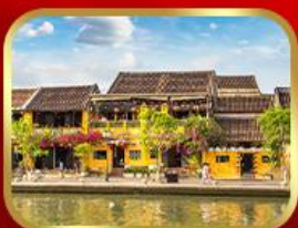
เที่ยวเมืองเก่าฮอยอัน