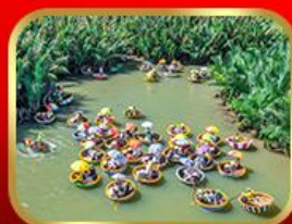
ล่องเรือกระดิ่งกั๊กทาน