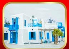
คาเฟ่ Son Tra Marina