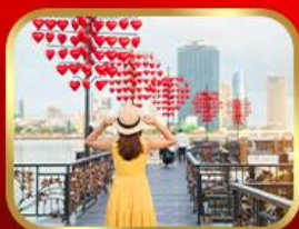
เชิควินสะพานแห่งความรัก