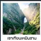
เขากิ๊ยนเหมินซาน