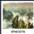
เซาอวตาร