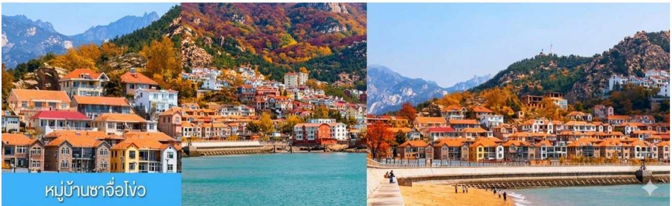
หมู่บ้านซาจื่อโ้ว

พักที่ WEIHAI BOYUE HOTEL / WEIHAI JIANGUO PUYIN โรงแรมระดับ 4 ดาวท้องถิ่นเมืองเวย์ไห่