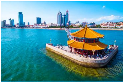
สะพานจ้านเจียว