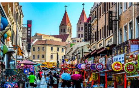
ถนนวงเวียน