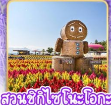
สวนซึกิไซโนะโอะกะ