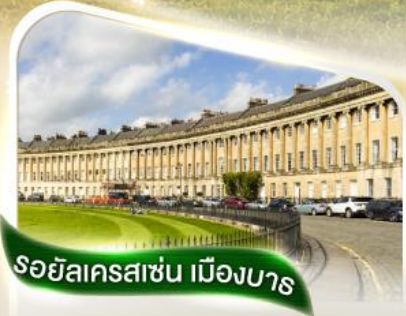
รอยัลครอสเชน เมืองบาร