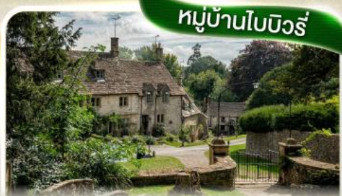
หมู่บ้านไบบิวรี่