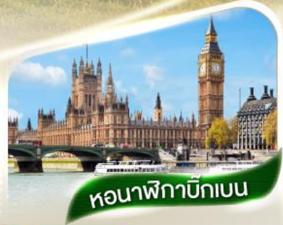
หอนาฬิกาบิกเบน