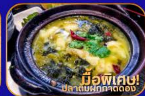
มีพิเศษ! ปลาต้มผักกาดดอง