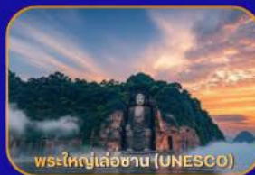
พระใหญ่เล่อซาน (UNESCO)

ล่องเรือชม "พระใหญ่เล่อซาน" - เมืองโบราณหวงหลงซี - แพนด้าเซลฟี - ห้างสรรพสินค้า - Wangjianglou Park - ถนนชุนซีลู่ (แหล่งช้อปปิ้ง) - IFS (แพนด้าปีนตึก) - วัดต้าเจี๋ย