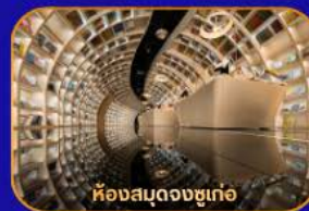
ห้างสรรพสินค้า