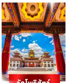
วัดโพธิ์สัตว์