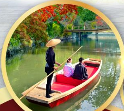
กิจกรรมล่องเรือยามากาวะ