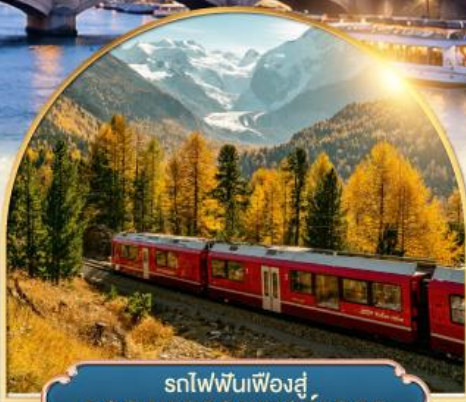
รถไฟฟันเฟืองสู่ยอดเขากรอนเนอร์เกรต