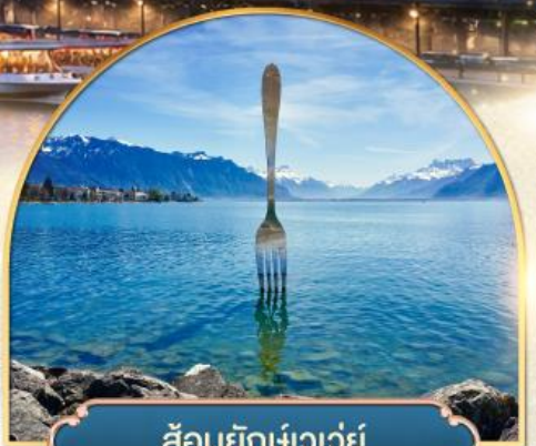
ล้อมยึกเขาวัว