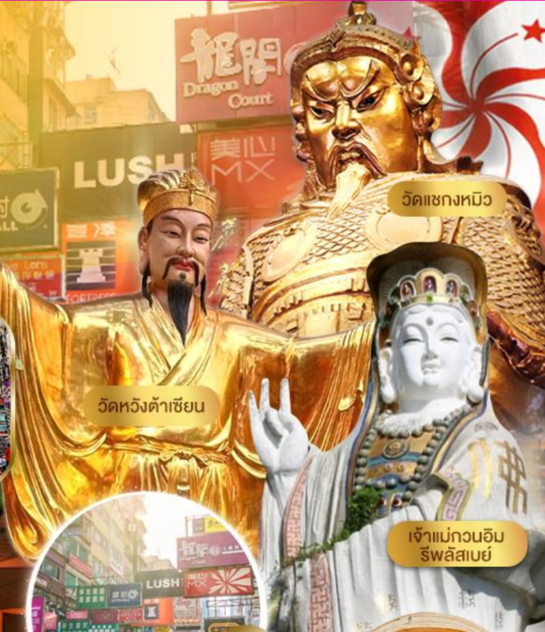
วัดเชงหมิว