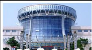
พิพิธภัณฑ์ทิวาสี

สวนสนุก FANTASYLAND - หมู่บ้านสไตล์ยุโรป พิพิธภัณฑ์ทิวาสี - ถนนคนเดินสามตรอกสองซอย ท่าเรือกิ่งจ้อ - ศาลเจ้าแม่กวนอิมพันกร เมนูพิเศษ อาหารทิวาสี , สุกีชาบูหม่าล่า