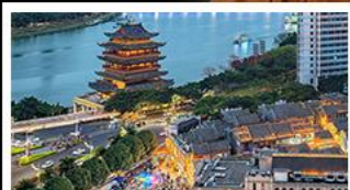
ถนนคนเดินสามตรอกสองซอย