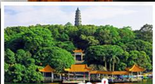
ภูเขาชิงชิว