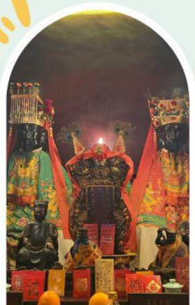
วัดหมิ่นโหมว