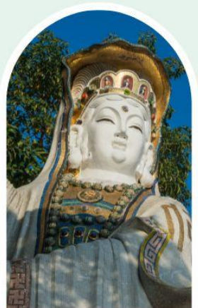
เจ้าแม่กวนอิม ธิพลสัย