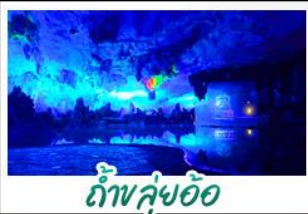
ถ้ำล้วยอ้อ

เขารู้อี+สะพานแดง - ล่องเรือแม่น้ำหลี่เจียง นาขั้นบันไดสีทองอร่าม - กำล้วยอ้อ - เขางวงช้าง เจดีย์เงินเจดีย์ทอง - รถไฟความเร็วสูง เมบูพิศช บูฟฟี่ต่ายบาร์บิคิว ปลาอบเบียร์ เผือกคริสตล สุกี้หืด