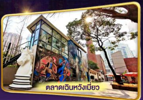
ตลาดเดินห้างเมียว