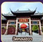
วัดหลงอา